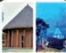
Templos y Saberes