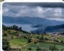
Lago de Tota